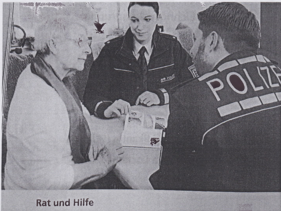
Rat und Hilfe